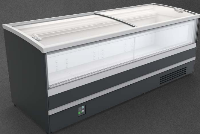
Imja WNIJ 2500 CCS