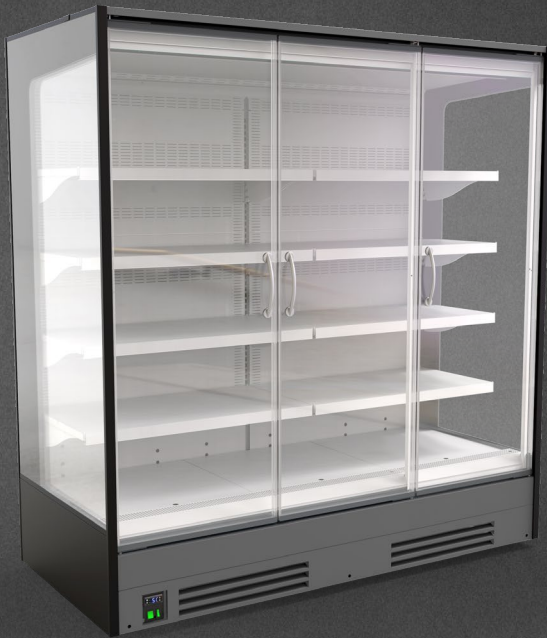
Garmo RDGA-L4 1875 DVO