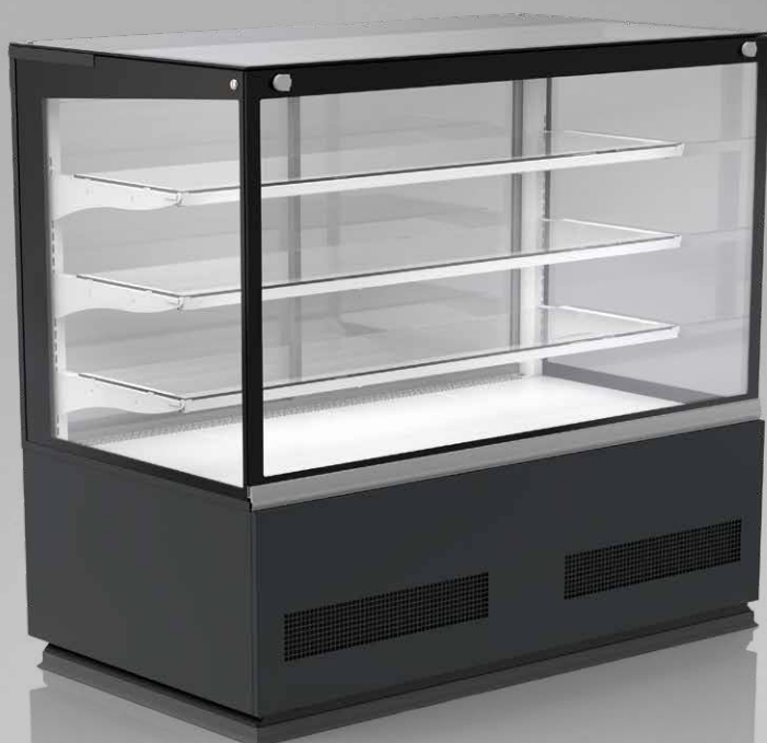
Elegant RDEL-21 1400 GDT

GDT – szyba i podwójna, prosta i uchylna